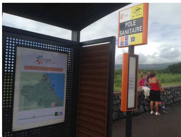
Abris-voyageurs du Pôle Sanitaire Est, Saint-Benoît, Sens Aller