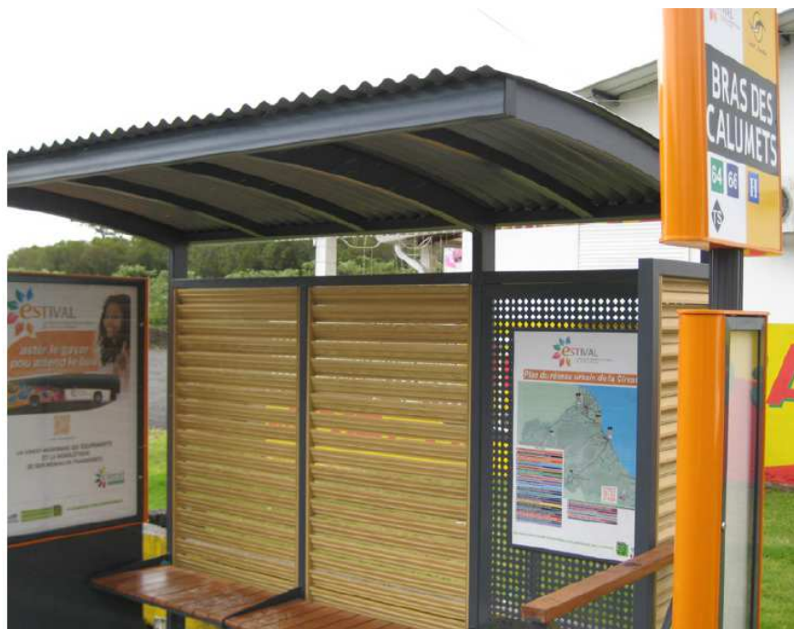
Abris-voyageurs «Bras des Calumets», Plaine des Plamistes